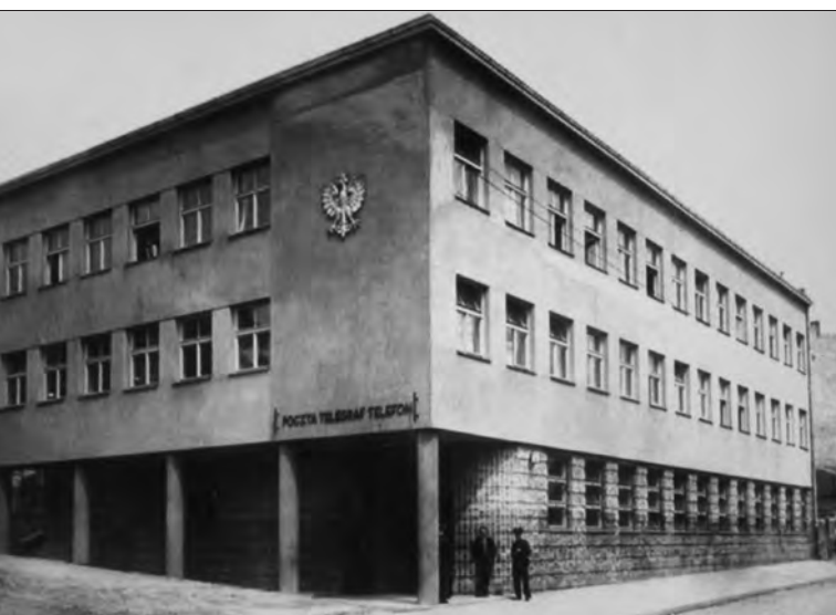
Приміщення збудованого у 1930-х роках поштамту успішно слугує лучанам і сьогодні.

Луцька. І завжди мала опонентів. По-перше, і це видно з книжки, місто в той час економічно розвивалося надто повільно. У ньому не збудовано жодного підприємства. Хіба що невелику дизельну електростанцію потужністю 300 кВт на вулиці Світлій (тоді Електричній). Про неї, до речі, у книжці не згадано. У місті був високим рівень безробіття.