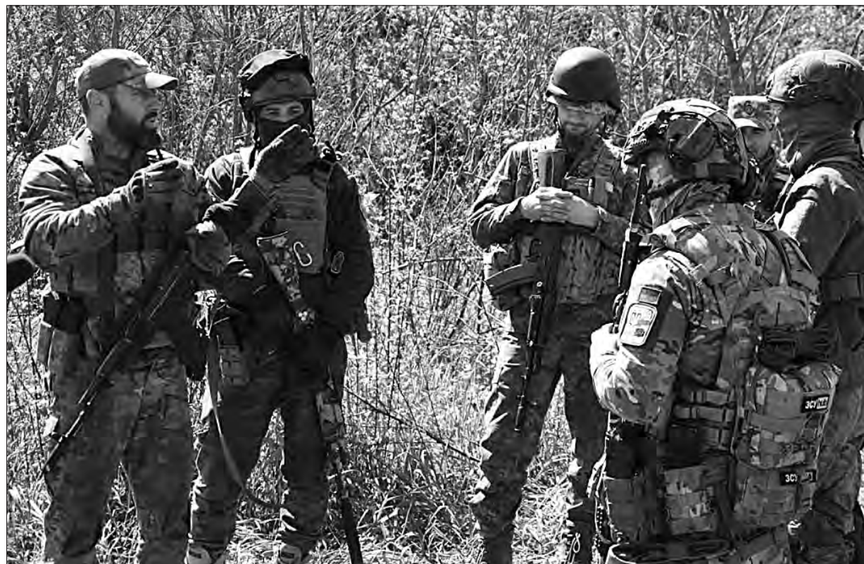
Прикарпатські тероборонівці удосконалюють навички.