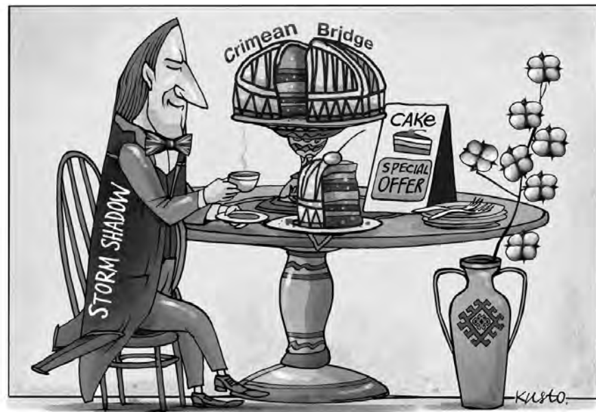
Джентльмен, чай, тістечко, «кримський міст» і бавовна.