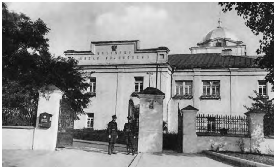
У цій колишній монастирській будівлі, що біля Свято-Троїцького собору, розташовувалась адміністрація Волинського воєводства.