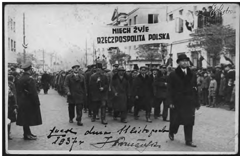
Колона демонстрантів на вулиці Ягелонській на честь чергової річниці проголошення незалежності Польщі 11 листопада 1937 року.

Микола ЯКИМЕНКО. Волинська область.