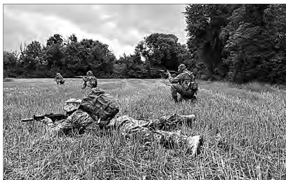
Навчання в польових умовах

Військовослужбовець наголошує на тому, що під час тренувань використовують натовську тактику та іноземні види стрілецької зброї. Бійці вчаться виявляти і знешкоджувати вибухівку, надавати першу домедичну допомогу та успішно виконувати бо-